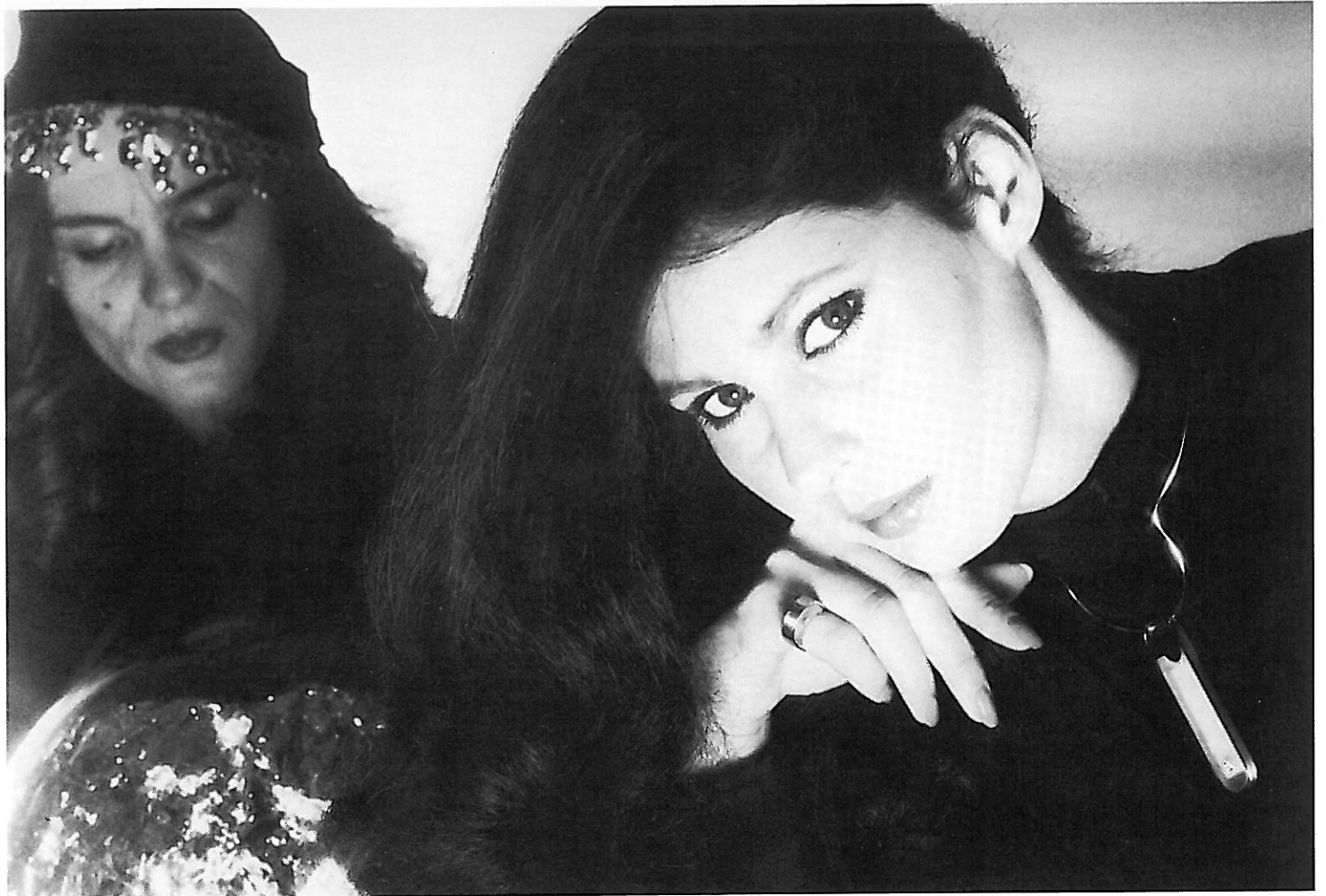
3. Preis Rainer Barthelsheim